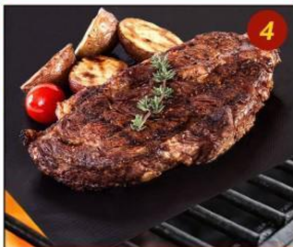
Uživajte na vašem pikniku