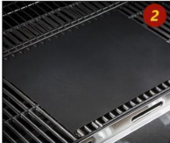
Položite podlogu na roštilj